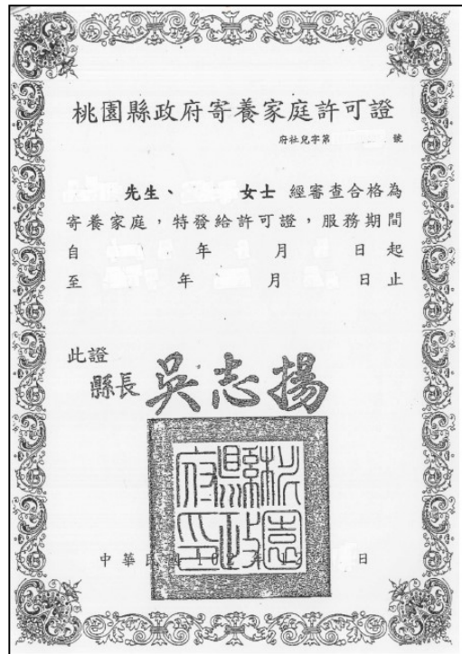
(圖四) 「安置文件」 舉例